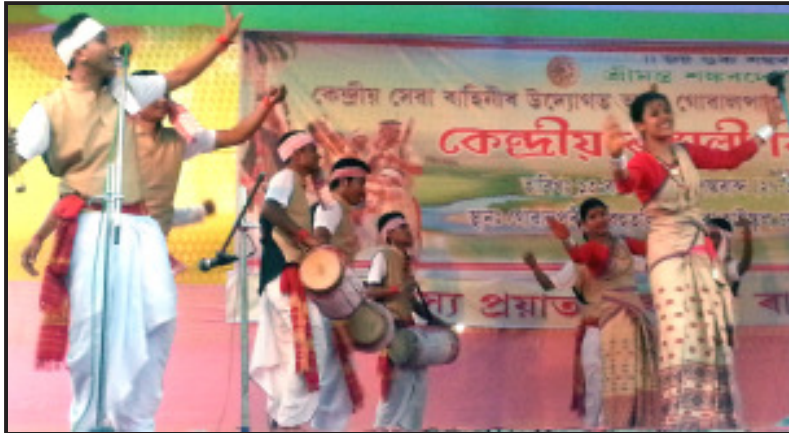
গোৱালপাৰা জিলা শাখাৰ আতিথ্যত যোৱা ২৭ এপ্ৰিল, ২০১৪ তাৰিখ দেওবাৰে এক (৬ পৃষ্ঠাত চাওক)

গোৱালপাৰা : শ্ৰীমন্ত শঙ্কৰদেৱ সঙ্ঘৰ কেন্দ্ৰীয় সেৱাবাহিনীৰ সৌজন্যত আৰু