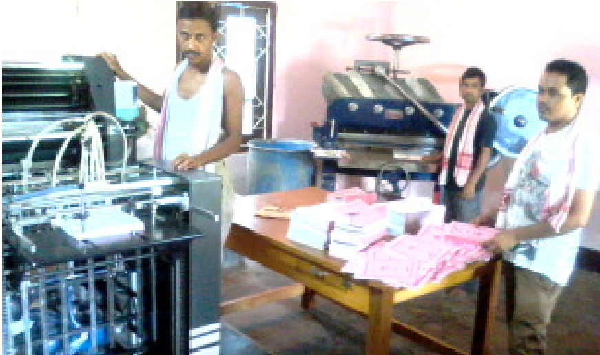
গুৱাহাটীৰ ৰূপনগৰস্থিত সত্যসন্ধা প্ৰেছত কৰ্মৰত অৱস্থাত কৰ্মচাৰীবৃন্দ