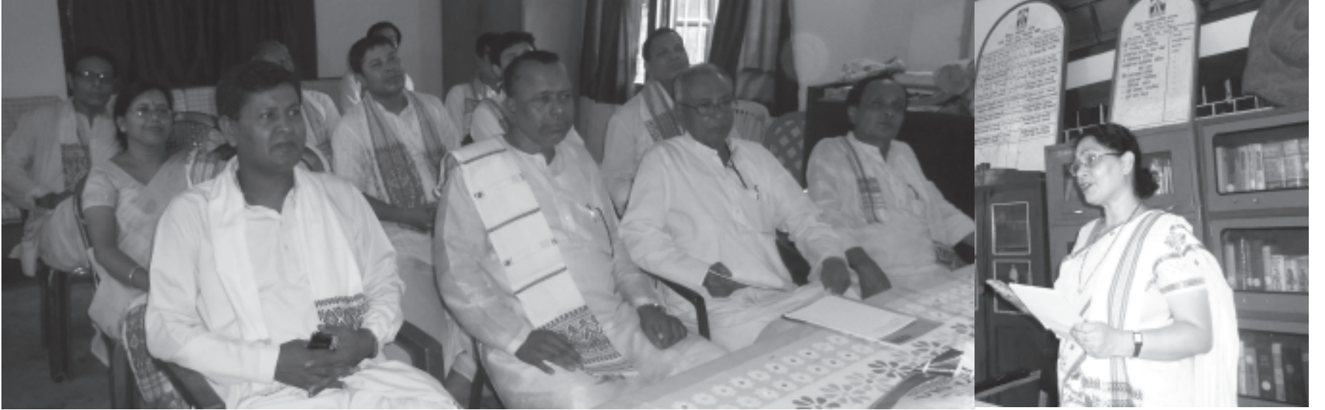
কৰ্মশালাত অংশগ্ৰহণকাৰীৰ একাংশ